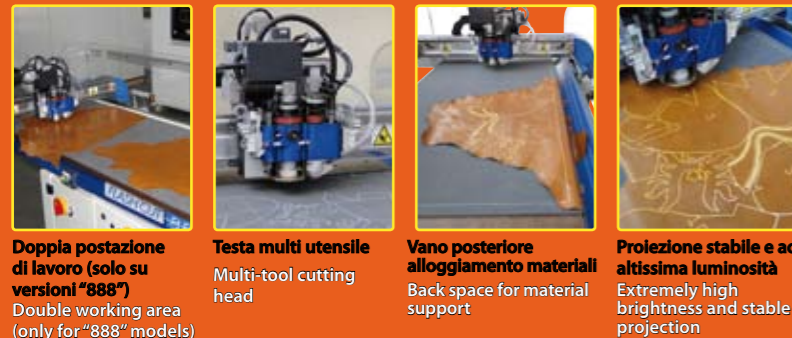
Doppia postazione di lavoro (solo su versioni "888") Double working area (only for "888" models)